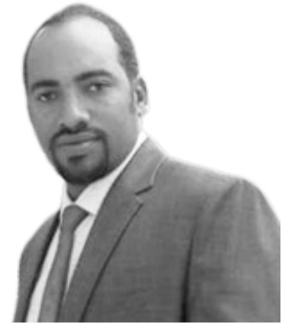
Kalaa Arbo Jaldeessa

Qoqqowohono ikko hawaasi quchumira mootimma dagoomu hobbaatenna keere agarsiisate assitanno sharro irkisatenni daga ga'labbote loosu hale ikkitanno gede komishiner Shimellisi sokkasi sayisino.