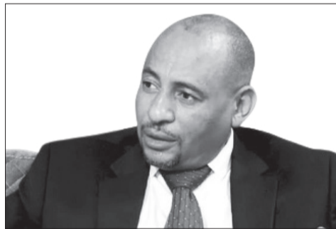
Liqe Tiguhann Rosiisaanchu Derejje Negaash Zeweyiniyye

Sa’u 15 durrara tenne ikkito giwate looso loonsanni keeshshinoonni yiinohu rosiisaanchu; yanna yannatenni hala’lanni dayinohunna seerimale mimmitu koo-koo/tee-